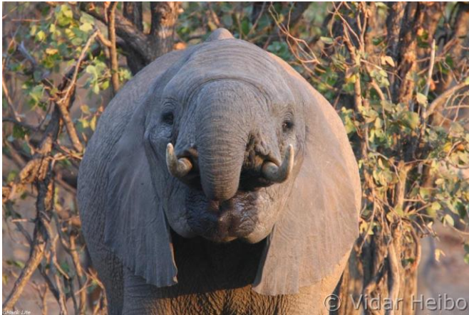
Elefant drikker i vannhullet, Punda Maria

Det blir et par korte stopp på vei nordover, før vi ut på ettermiddagen kjører inn i Kruger National Park, for mange kanskje turens høydepunkt? Vi kommer tett på giraffer og elefanter med en gang, før vi kjører inn i Punda Maria camp, den enkleste og nordligste av alle leirene i Kruger. Her går solen ned over vannhullet, før vi avslutter med en nydelig utemiddag.