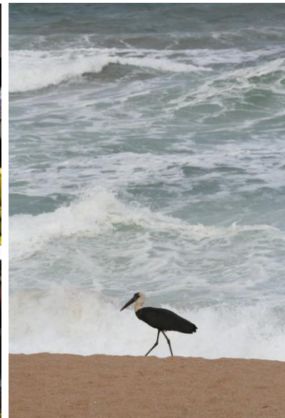
Ullhalsstork "på beachen" (hv)

Utpå dagen setter vi oss i bussen for en lang reise, og tar turens lengste kjøretur, ca 7 timer effektiv kjøring til Underberg/Himeville, via Durban. Men før Durban prøver vi å organisere en lunsj på stranden med litt sjøfuglskoding, og sannelig får vi ikke sett knølhval som puster og peser i de høye bølgene utenfor Blythesdale Beach.