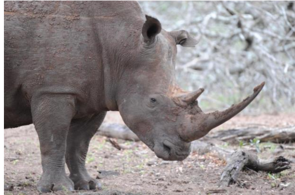
Neshorn, skeptisk i kveldslyset, uMkhuze (jer)

I tillegg går vi en lang tur i området der vi bor, dette er en helt spesiell biotop, da skogen vokser på sand. Vi er nå i det "tropiske" hjørnet av Sør-Afrika og mange spesialiteter dukket opp, bla ble det mange solfugler.