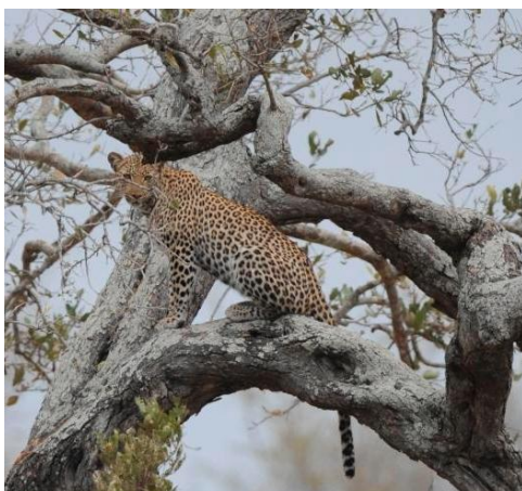
Leopard, Satara W (jer)

Etter lunsj får vi endelig et tips, leopard 5 minutt fremover. Og der sitter den, tydelig høyt i et tre. Etter femten minutter hoppet den ned og trakk unna, så marginene er små for slike opplevelser.