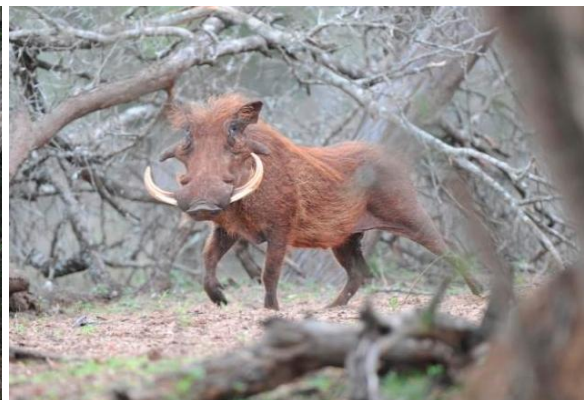
...men vortesvin og andre dyr var aldri langt unna! (jer)

For mer informasjon om reservatet og overnattingssted, se: