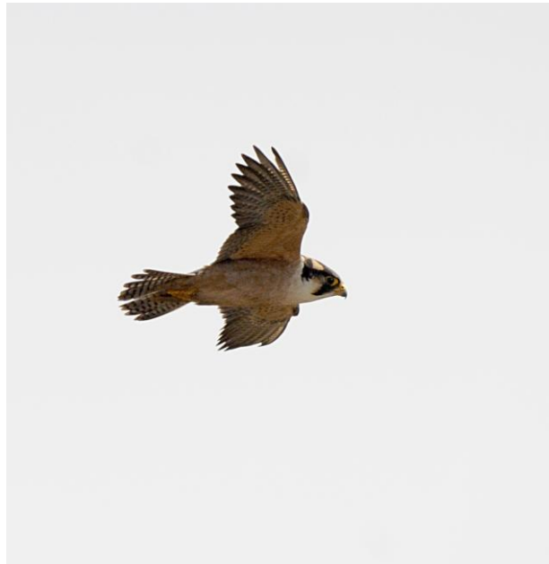
På det nærmeste helt unike bilder av den lille og sjeldne svalefalken (jer)

Etter denne flotte starten på dagen, bruker vi mye tid på vei sørover i Mpumelanga, tidligere bedre kjent som Transvaal. Etter noen spennende stopp underveis, krones med at vi kommer frem til Wakkerstroom like før solnedgang. Og her, på gressletter med "snaufjell" rundt, møter vi Gråkrontrane som danser i kveldslyset. Magisk!