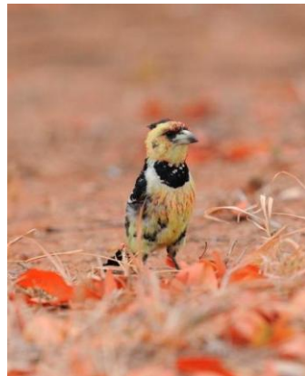
Topperleskjeggfugl, Little Eden (jer)

Noen fuglearter: kamand, rødnebbband, hottentottand, slettefalk, stripehodeviipe, afrikabekkasin, spragledue, maskedue, kjempeisfugl, hvitpannebieter, grønnkakelar, perlebrystsvale, karmingonolek, karoostær, flikstær, bantusteinspurv, tykknebbvever, kappvever, gulkronebisp, rødkragevever, rødnebbamarant, bronsemannikin, gulbrystastrild.