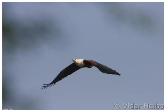
Flodørn, vanlig ved alle vassdrag (vh)

Det blir mange fine opplevelser, og følelsen av å kjøre over savannene er sterk. Men det blir mange timer i bil, da det ikke er lov å gå ut av bilen utenom rasteplasser. Vi har en strålende lunsj i Shingwedzi leir, sammen med glansstær, apekatter og skolebarn.