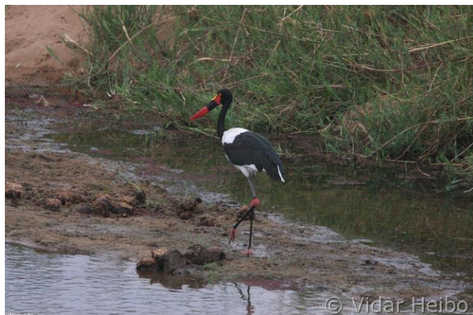
Sadelnebbstork, Letaba River (vh)

Vi kjører ut av nasjonalparken ved Orpen, og trekker vestover mot fjellene igjen. Vi trekker opp igjen "the escarpment", og kommer på kvelden frem til Blyde Canyon Resort. Blyde Canyon er et utrolig område med verdens