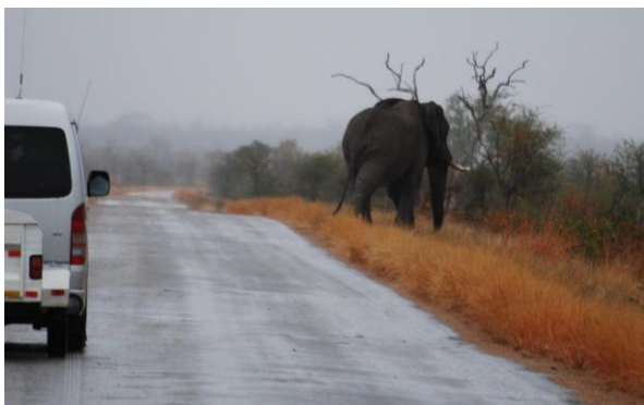
Vikeplikt, i yr, Punda Maria S (kan)

Vi starter i områdene rundt leiren, før vi sakte beveger oss sørover, passerer vendesirkelen, og kikket etter fugler og pattedyr på de lett skogkledde savannene i KNP. Dette var den store safaridagen, men været ble litt spesielt med lett regn og yr i starten.