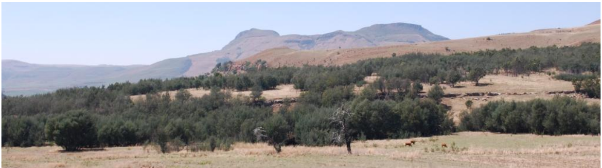
Gjennom Zululand kjører vi langs grensen til Swaziland, eget kongedømme og nasjonalstat (kan)

Ved lunsjtider setter vi kursen mot sørøst, ned fra høylandet og inn i subtropiske Zululand. Vi kjørte nå inn i iSamangaliso, ett stort parksystem som rekker ut til det indiske hav, og som er Sør-Afrikas første verdensarvsted. Vi kommer frem til uMkhuze dyrereservat, av mange ansett som Sør-Afrikas mest spesielle reservat, der en rekke av de mest kjente dyrefotografier og filmer fra Afrika er tatt opp.