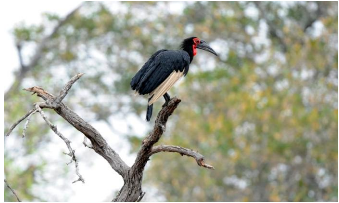
Rødmaskehornravn, sjelden i tretoppene (jer)

Noen fuglearter: kampørn, øglehauk, rødtopptrappe, sandløper, steinvender, purpurkroneturako, gråhubro, rødmaskehornravn, grønnekakelar, skjeggspett, halsbåndsvale, savannepirol, akrobatbylbyl, brunkronesjagra, svartkronesjagra, rødhodevever, grønningestrild