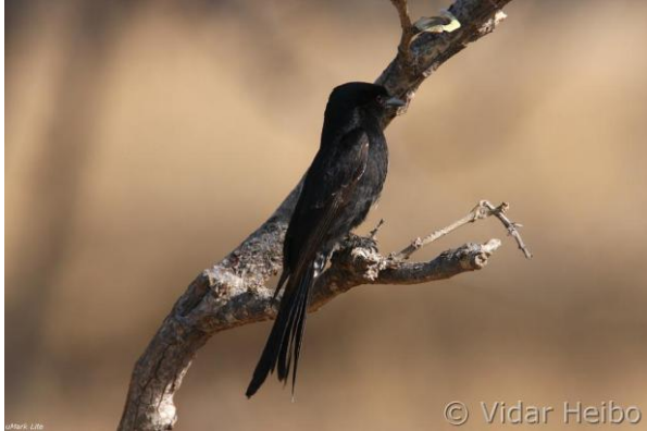
Savannedrongo, uMkhuze, Kwa-Zulu Natal (vh)

Hele dagen brukes i uMkhuze reservatet. Vi kjører til ulike biotoper, men i hovedsak bruker vi mye tid ved et vannhull, med rikt dyre og fugleliv. Der oppholder vi oss i et lukket utsiktspunkt ("hide") i mange timer, og fikk nærkontakt med mange fugler og pattedyr, blant annet et nesehorn.