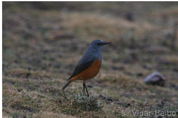
Vaktsteintrøst, Lesotho (vh)

Vi emigrerer fra Sør-Afrika (der "slutter" veien) og kommer først på toppen til grenseposten til Lesotho. Nye stempel i alle pass. Været har gått over til snøstorm, men vi fortsetter litt innover i "høyfjellet" inne i Lesotho. Men etter en kald lunsj inne i en stall, valgte vi å snu. Likevel får vi med oss noen av de mest spesielle artene her oppe.