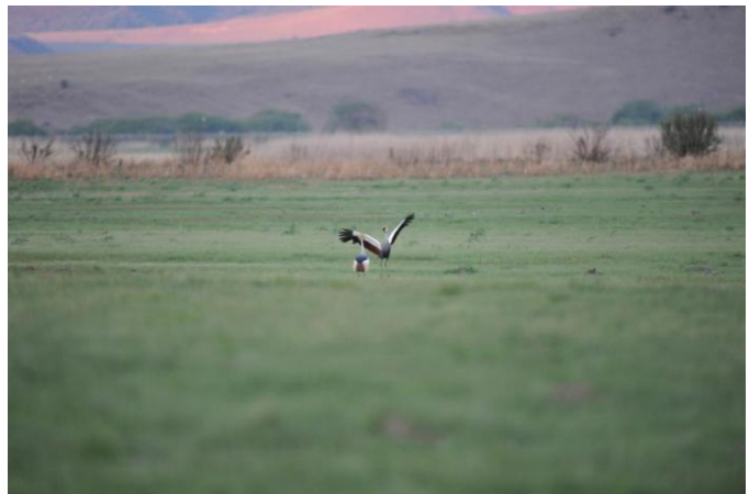
Gråkrontrane, kurtise, Wakkerstroom (jer)

Noen fuglearter: duskhegre, afrika-skjestork, hvitryggand, kappskjeand, flodørn, toppørn, afrikasivhauk, svalefalk, knoppsothøne, blåtrane, grønnstilk, flekktriel, gråhodemåke, hvitstrupesvale, brunstrupesandsvale, hvitbrystkråke, svartstrupe, maurskvett, torntrosteskvett, kanelbukstumpsanger, gulgumpirisk.