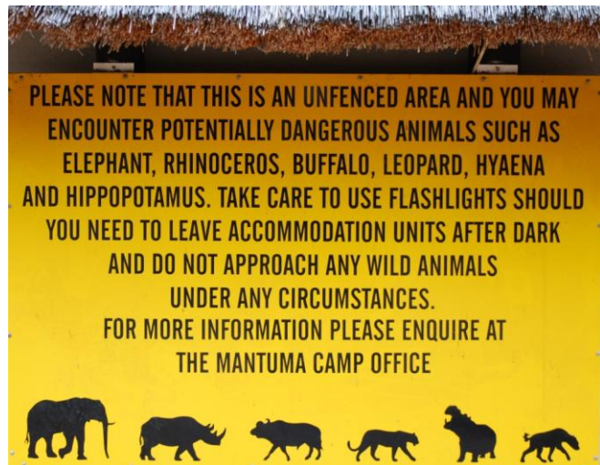
Lite løve..., men spennende nok med middag ute i det fri i mørket (kan)

Noen fuglearter: rosenpelikan, afrikaåpennebb, hvitryggribb, kampørn, afrikabladhøne, brunhodepapegøye, savanneisfugl, rødpannekobberslager, bantuspett, svartsagsvale, gulbukbylbyl, mosambikapalis, viftefluesnapper, blekfluesnapper, brubru, svartbukglansstær, thongasolfugl, bantu-steinspurv, skogvever, svarthaleastrild, rosenastrild, gulbrystspurv.