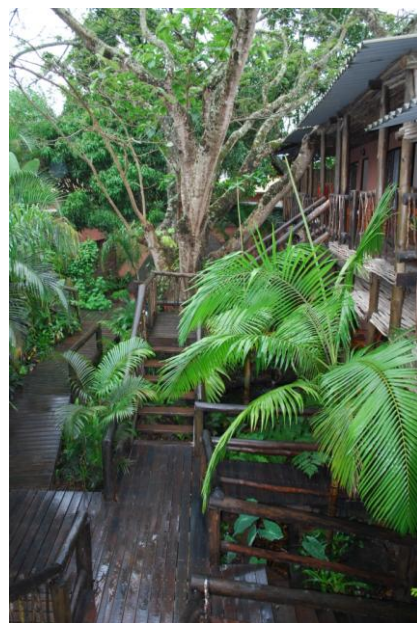
Tropisk hage, Umlilo Lodge (kan)