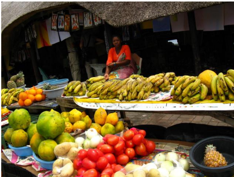
Lokalmarkedet i St Lucia (es)

iSamangaliso er et enormt stort våtmarksreservat som vi ikke satte av så mye tid til. På morgenen brukte vi litt tid i området nord og sør for St Lucia, men "neste gang" kommer jeg til å bruke en dag til her! Men vi får med oss noen flotte observasjoner av virkelig sjeldne arter denne dagen, samt litt varme i kroppen etter noen dager med dårlig vær.