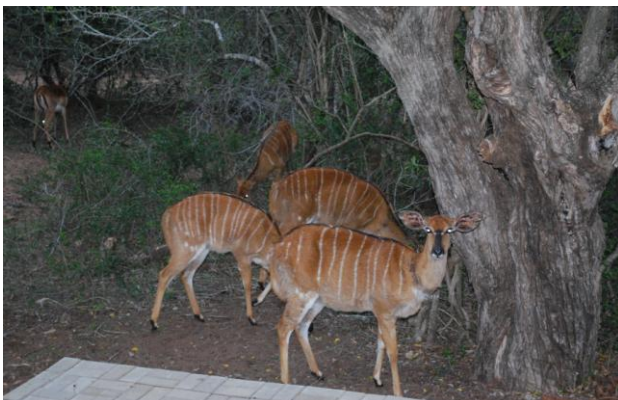
Bare Nyala å se i blitsen fra terrassen....? (kan)