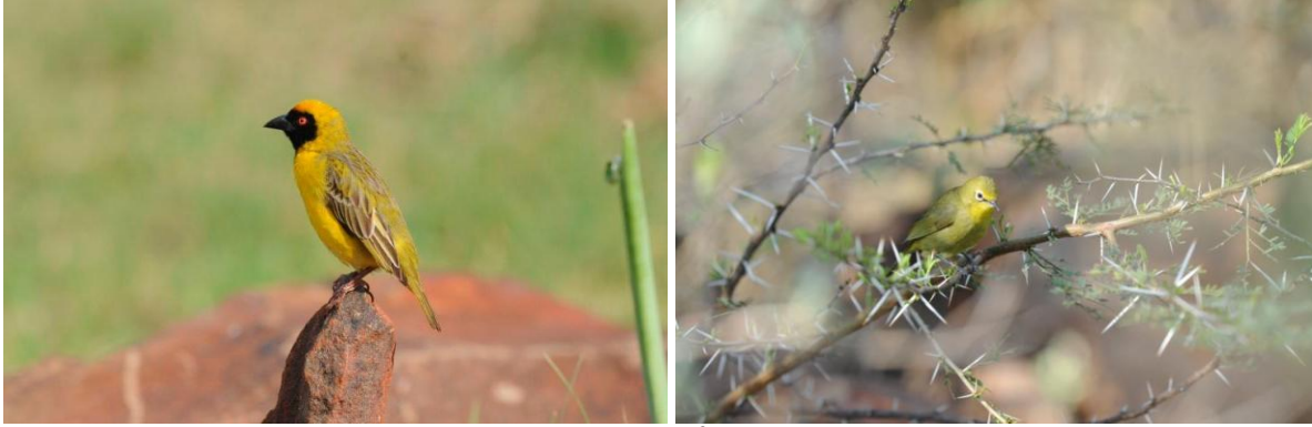
Svartmaskevever og kappbrillefugl, karakterarter på turen og representanter for hundrevis av småfuglarter i det frodige landskapet (jer)

Det er kort vei til flyplassen, og vi kjører i det mørkret senker seg og mange gressugler åpenbarer seg for oss som en siste hilsen. Vi ankommer flyplassen i god tid. En flyplass som er preget av at fotball-VM starter om 7 måneder.