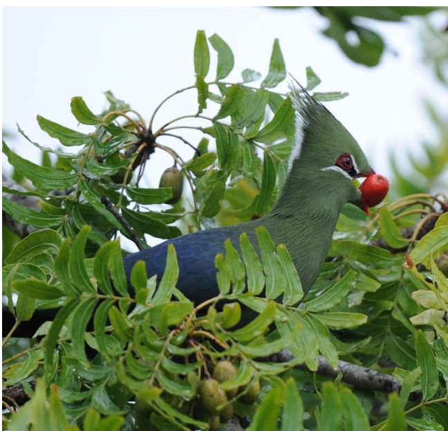
Grønn turako, midt i St Lucia sentrum (jer)

Vi overnatter på Umlilo Lodge, inne i lille koselige St Lucia. Her er vi virkelig i tropene, med trapper og balkonger i en frodig hage, med trompethornfugl på taket. Her tror jeg alle trivdes spesielt godt. Dagen ble avsluttet med en tur helt ut til havet, der krokodiller og flodhester lå på sandbankene helt ut til stranda (der man ikke bader pga store bølger og hvithai).