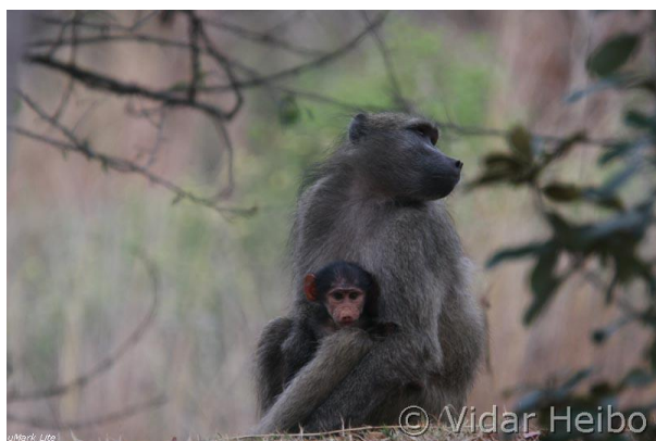
Bavianer, Blyde River Canyon (vh)

Etter lunsj er det rett og slett hvile. Vi har et par lange dagsetapper foran oss, så nå er det fri! Eller oppladning til middag, som nok var den beste av alle de flotte middagene vi fikk.