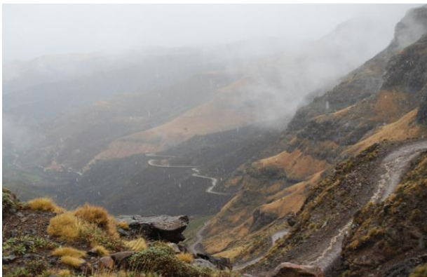
Sani Pass i Drakensberg, veien til Lesotho (kan)

Denne dagen er satt av til en heldagstur i jeoper opp Sani Pass og inn i fjellene i Lesotho, til nesten 3000 meters høyde, alt en del av de sørlige Drakensberg! Vi bruker ufattelig mange timer oppover på en utrolig dårlig vei som ikke eksisterer engang offisielt. Vi kommer til stadig nye biotoper med nye arter, selv været skifter vilt.