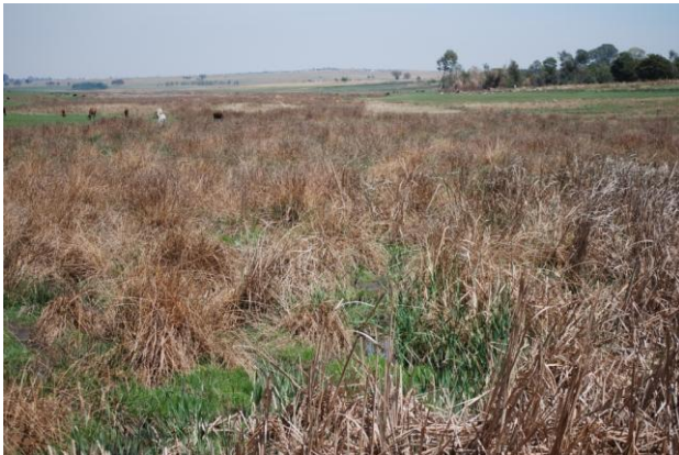
Highveld utenfor Bronkhorstspruit, Gauteng (kan)

Ingenting er så fantastisk som å våkne opp første morgenen til lys og lyder i Afrika! Og lenge før frokost var de fleste ute rundt hyttene våre og gjorde seg kjent med de første fuglene, og etter frokost ble det en tur i området, blant annet langs elva som renner gjennom området.