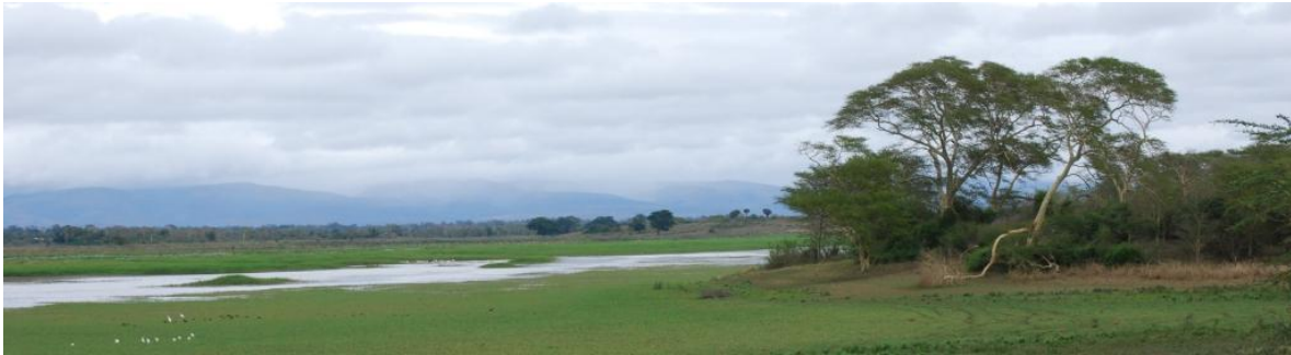
Tropiske våtmarker N i iSamangaliso Wetland Park, Kwa-zulu Natal (kan)

regntid. Vi blir mye i et fantastisk våtmarksområde på sørsiden av uMkhuze, samt spennende elveskogstrekninger med virkelig imponerende trær.