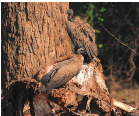
Hvitryggribb på elefantkadaver